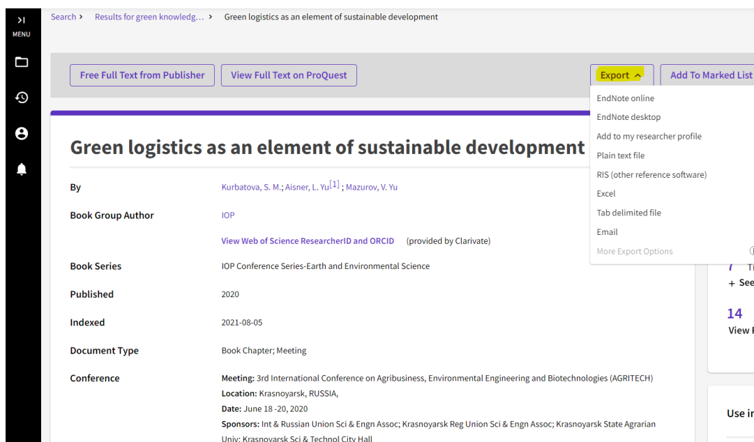
Slika 1.1: Primer za bližnjico do izvoza navedbe reference iz WoS v izbrano orodje

Primer za bližnjico do izvoza navedbe reference iz WoS v izbrano orodje je prikazan na Sliki 1.1.